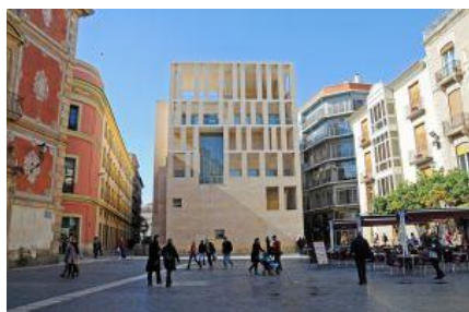
Fachada del Ayuntamiento de Murcia, en la plaza del Cardenal Belluga, obra de Rafael Moneo.

Bajo el arco de San Juan, en el corazón del casco antiguo, encontramos el lugar perfecto para desayunar: el emblemático Café del Arco (1) (Arco de Santo Domingo, 1; 968 21 97 67), con un toque de diseño y un curioso panteón de cuadros de personalidades locales obra de Martínez Cánovas. Desde aquí la ciudad se abre como un puzle. Una opción es encaminar los pasos hacia la universidad para visitar el Museo de Bellas Artes (2) (Obispo Frutos, 12; 968 23 93 46), la pinacoteca más importante de Murcia, con obras de José de Ribera, Sorolla o Julio Romero de Torres. Otra, bajar por Trapería y Platería, estrechas y peatonales, flanqueadas por tiendas de lujo, hasta la catedral.