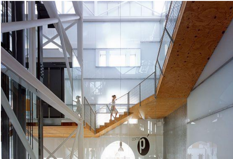
El Centro Párraga de artes escénicas, de Antonio Abellán.

Archivado en: Murcia Turismo ciudad Viajes Región Murcia Destinos turísticos España Ofertas turísticas Turismo