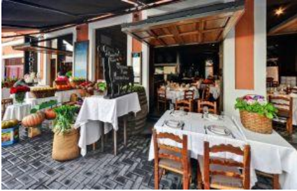
Restaurante La Pequeña Taberna.